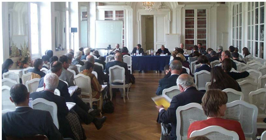
Séminaire de la Fondation européenne de Turin sur le thème de la validation des acquis de l'expérience - 28 - 29 janvier 2002

Pour se procurer les actes du colloque, adressez-vous au CIEP, Département de la coopération en éducation, dce@ciep.fr .