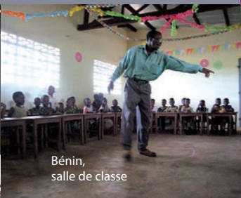
Bénin, salle de classe