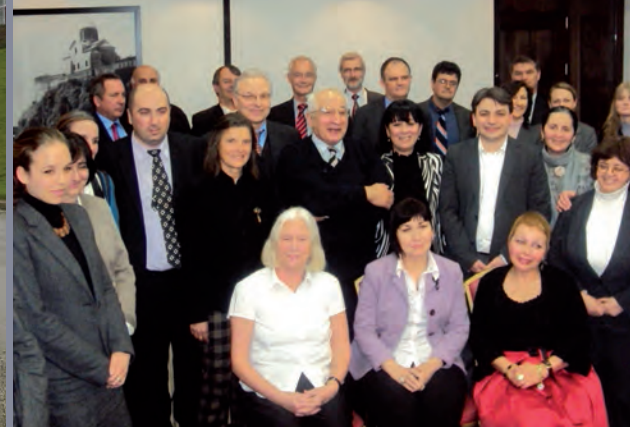
Projet CEIBAL, conférence finale le 10 mars 2011, Tbilissi (Géorgie).