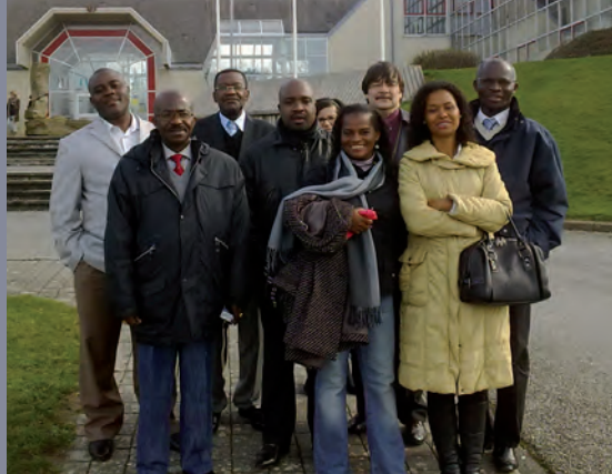
FSP Angosup, visite d'étude du 21 au 25 février 2011.

Le CIEP appuie, sur un financement de l'AFD, la Conférence des ministres de l'éducation des pays ayant le français en partage (CONFEMEN) pour la restructuration de la base de données du Programme d'analyse des systèmes éducatifs (PASEC), analyse qualitative des systèmes éducatifs dont 27 pays membres de l'organisation ont bénéficié depuis 1993. Cette restructuration permettra d'agréger les données relevées de 2000 à 2009 d'une part et, d'autre part, de réaliser un document de synthèse vulgarisé des résultats du PASEC pour la période 2004-2009, à l'adresse du grand public. Une restitution des travaux est prévue à Dakar, au siège de la CONFEMEN, en juin 2011.