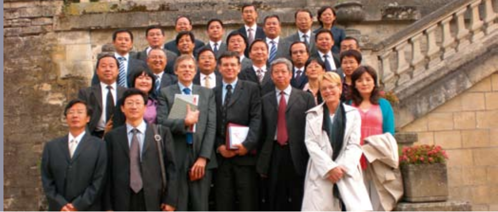
Visite d'études d'administrateurs d'universités chinoises, février 2010.