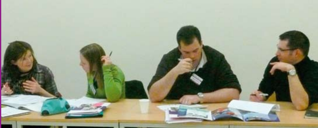
Échanges de bonnes pratiques pendant le séminaire Inter-Action, janvier 2010.