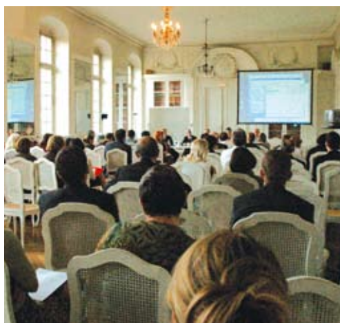
CIEP, octobre 2009. Près de 100 participants en provenance de 10 pays lors du séminaire international.

nelles et comportementales, mais aussi importance et rôle des notions de validité, de standardisation, de fidélité, de sensibilité discriminative et d'équité dans la mesure. Ce congrès qui a rassemblé des acteurs issus de milieux très divers mais tous sensibilisés au domaine de la psychométrie qu'ils soient représentants institutionnels, universitaires ou spécialistes issus du monde du travail, a atteint ses objectifs. Aux termes des débats et des discussions, une seconde édition a été envisagée pour 2011.