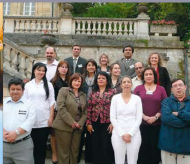
Séminaire EUROsociAL Mise en œuvre d'un référentiel de compétences pour les enseignants de l'enseignement technique.