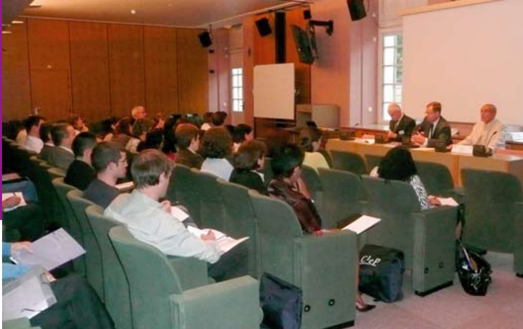
Séminaire bilingue francophone Universitaires et enseignants en provenance de 17 pays.