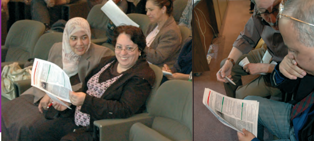
Séminaire des directeurs de CEIL. Travaux pratiques en salle de conférences, mai 2009.