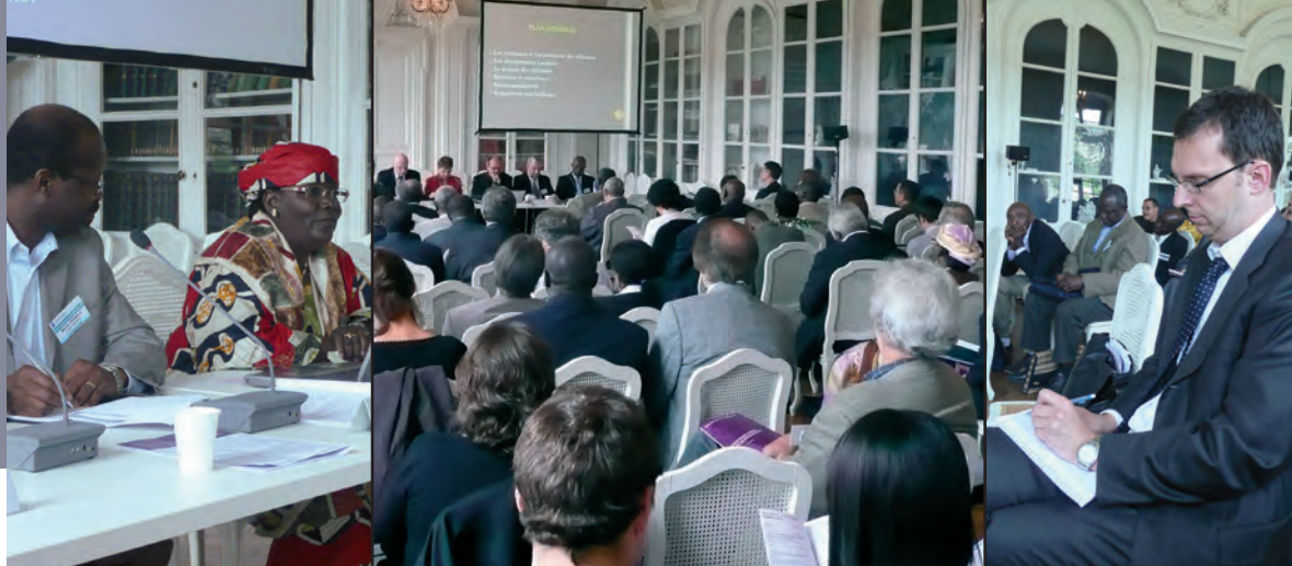
Réformes curriculaires. Analyse des cinq études-pays, Grande bibliothèque, juin 2009.

■ Dans le cadre de ses missions de coopération éducative, le CIEP a organisé un séminaire pour un groupe d'experts qui lui sont associés. Après une présentation de la politique de l'établissement, les échanges ont porté sur les principaux axes de travail du CIEP à l'international (accompagnement des politiques publiques et des réformes ; évaluation, normes et qualité ; mobilité ; formation) sous un triple éclairage : actualité, priorités, prospective. Trois ateliers ont permis ensuite aux 30 experts présents de réfléchir à la notion de « professionnalisation » ainsi qu'aux outils et aux moyens nécessaires pour travailler dans les « règles de l'art ».