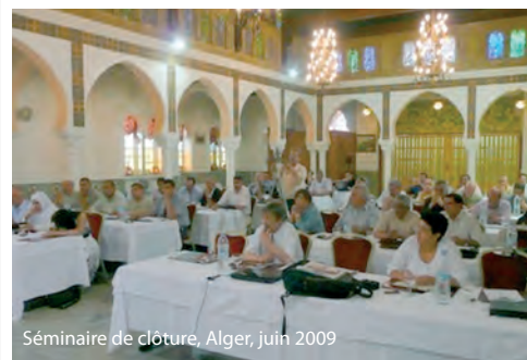
Séminaire de clôture, Alger, juin 2009

gramme que tous les participants ont soulignée.