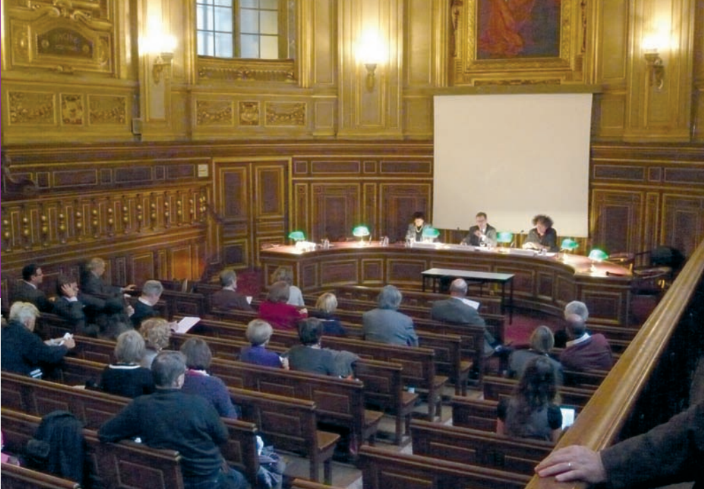
Novembre 2008, en Sorbonne, amphithéâtre Louis Liard. Faire l'histoire c'est aussi l'enseigner.