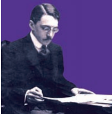
Une certaine idée de l'école