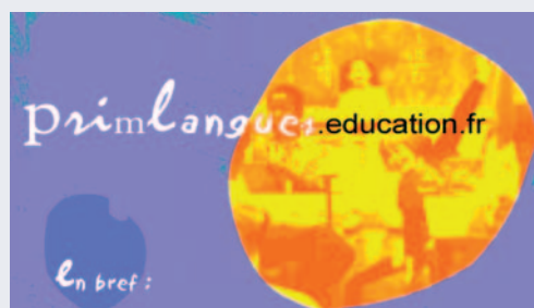
PrimLangues. Un site internet du ministère de l'Éducation, géré par le CIEP, en appui à l'enseignement des langues dans le primaire.

PrimLangues, le site d'accompagnement pour l'enseignement des langues vivantes dans le premier degré, témoigne de cet engagement plurilingue, en offrant des ressources pour l'enseignement de 7 langues, tout comme les divers programmes que le CIEP gère et anime : programme d'échange d'assistants de langue vivante, échanges poste pour poste pour enseignants, stages linguistiques etc. A l'instar de l'introduction du DELF scolaire dans 14 systèmes éducatifs étrangers, une réflexion est en cours sur l'opportunité d'utiliser des certifications étrangères dans le système éducatif français. ■