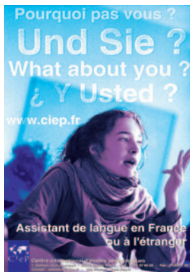
Assistant de langue en France ou à l'étranger, pourquoi pas vous ?

6 200 assistants étrangers en France en provenance de 42 pays (13 langues dont deux nouvelles : turc et néerlandais)